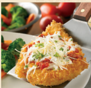
تشيكين البارميزان CHICKEN PARMESAN