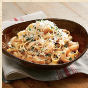
توومبا باستا TOOWOOMBA PASTA

An Aussie cheeseburger seasoned and seared burger topped with balsamic caramelized onions and two layers of pepper cheese sauce